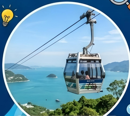
Over-the-sea Cable Car